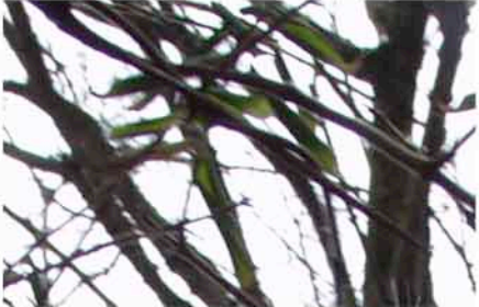
Bild 3 ist ein Grenzfall, weder ist das Bild gestochen scharf noch wurde das Bild auf den ersten Blick sichtbar verwackelt