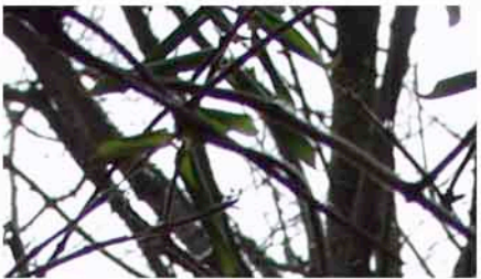
Bild 1 und 2 sind scharf bei der Zeit von 1/125 und 1/60 ist es im Normalfall noch kein Problem ohne Stativ zu fotografieren